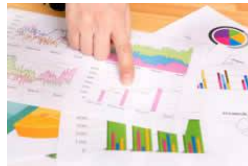
広告レポート出力