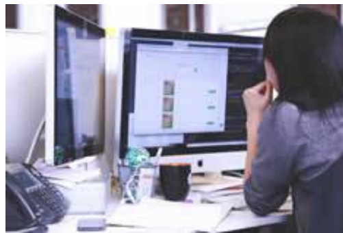
Webサイト運用サポート