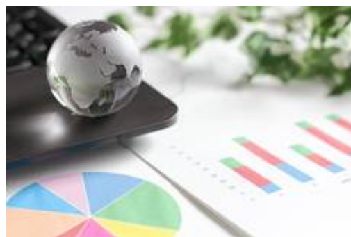
資料作成 (パワポ、エクセル)