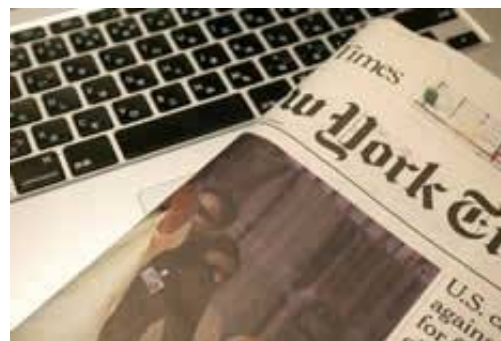
バイリンガル事務 (日英)