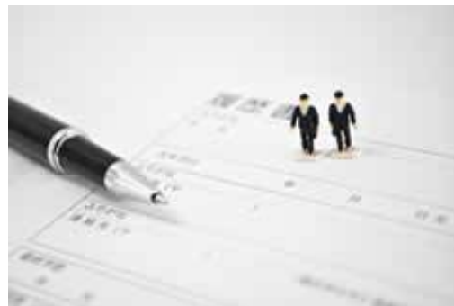
面談調整、労務サポート